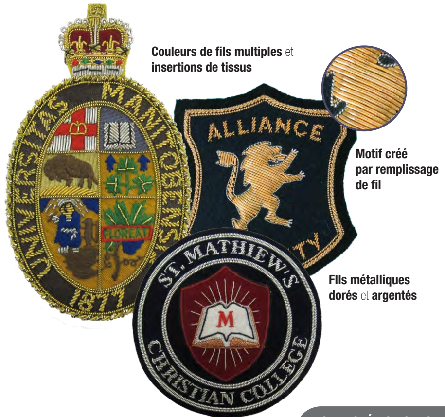
Couleurs de fils multiples et insertions de tissus

La méthode de broderie de fils métalliques est parfois appelé "le travail de l'or ou "la broderie à la main", selon laquelle les emblèmes sont individuellement et méticuleusement conçus en utilisant des techniques transmises de générations en générations. Les emblèmes brodés de fils métalliques sont fortement texturés et se distinguent facilement lorsque cousus sur les uniformes de service, les blazers, les vestes et autres types de vêtements de loisirs, d'associations et clubs. Les emblèmes peuvent être créés selon de nombreuses formes et tailles personnalisées, et peuvent être équipés avec épingles à fermoir. Un lavage très doux ou un nettoyage à sec est fortement recommandé pour ces emblèmes.