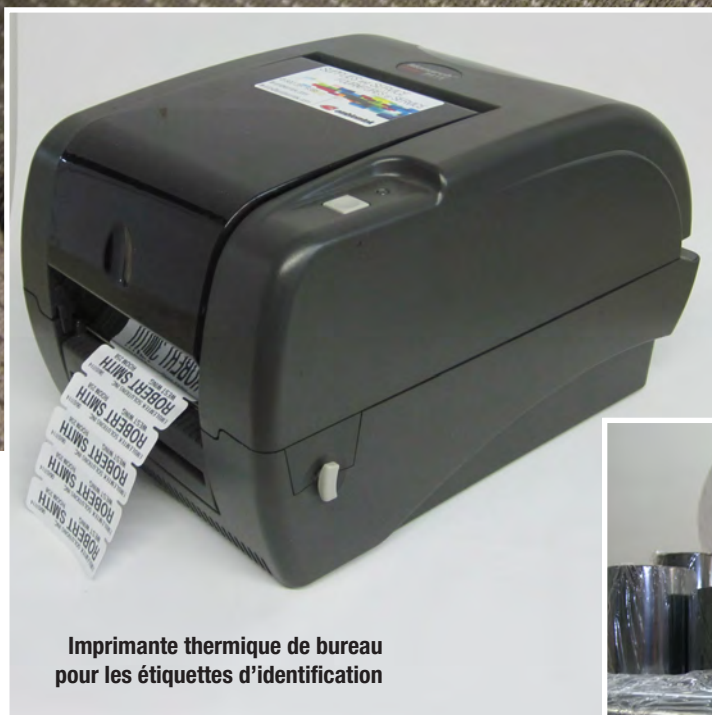
Imprimante thermique de bureau pour les étiquettes d'identification

Le codage par points de couleur est utilisé pour marquer et localiser rapidement les vêtements et textiles par la couleur.