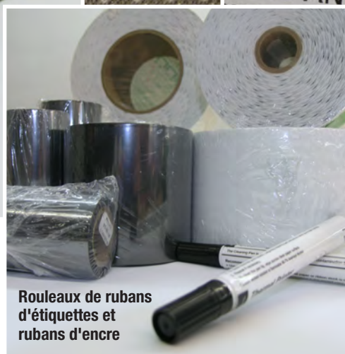
Rouleaux de rubans d'étiquettes et rubans d'encre

Les étiquettes d'identification de vêtements sont principalement utilisées pour marquer, identifier, classer et localiser les vêtements et le linge dans les domaines de la blanchisserie ou de la transformation de textiles. Elles sont généralement appliquées aux uniformes, vêtements de travail, vêtements de fonction, vêtements et linge d'hôpitaux et de résidences de personnes âgées, ainsi qu'au linge destiné aux hôtels et restaurants.