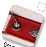
Grommet & split-ring Oeillet et anneau à clés