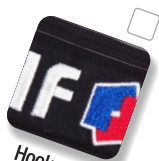
Hook-and-loop fastener Fermeture auto-agrippante

Emblems with accessories attachment options. Emblèmes avec accessoires optionnels.