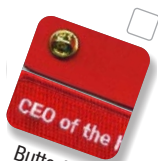
Butterfly clutch Fermeoir papillon

Application guidelines: heat seal or sew-on. Directives d'application: à thermocoller ou à coudre.